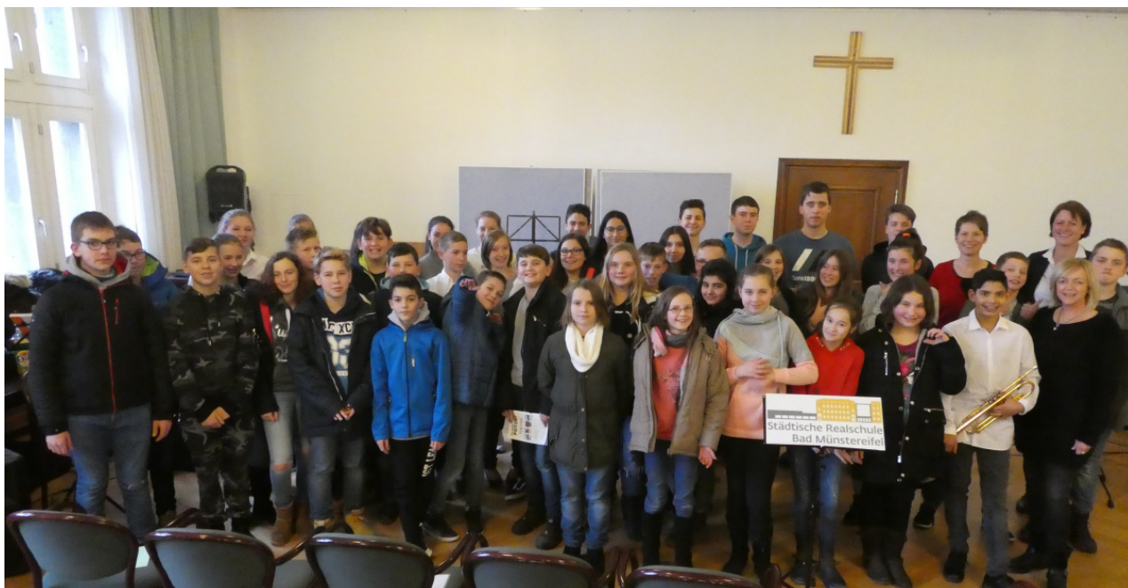
Die Musiker der städtischen Realschule bei ihrem Besuch im Rathaus.